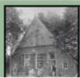
Levensgroep Anfgood Buurse