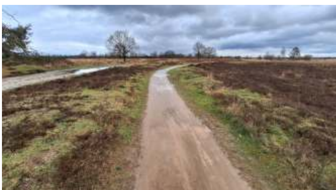
Foto impressie Veen- en Heidewandeling